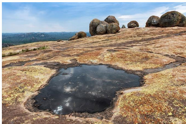
"Worlds View" kaldes denne naturlige klippeformation i Matopo National Park.

Matopo National Park er et UNESCO World Heritage Site med en særegen natur, godt 30 000 år gamle hulemalerier og både sorte- og hvide næsehorn.