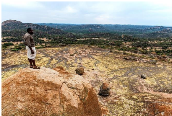
De største huler har ofte fantastiske udsigter. Her boede Sanfolket 3- 4 familier sammen.