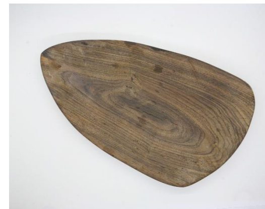
Varer som flotte træ- eller kurvevarer kunne komme fra dette område.

I Huset ved Havet håber vi på, at vi, i en ikke fjern fremtid vil kunne købe nogle af vore produkter fra lokale kunsthåndværkere i Matabeleland South nær Matopo.