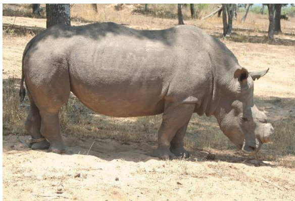
En flot Han med afhugget horn fra en privat park i Zimbabwe.

Da området blev udlagt til national park 1926 var der ingen naturlige næsehorn i Matopo, men fordi man fandt dem på de store malerier i hulerne i parken, blev de genindsat med dyr fra Zambezi dalen i det nordlige Zimbabwe. I mange år levede næsehornene en god og relativ skjult tilværelse og National Park myndighederne kunne passe på dem med få Rangers.