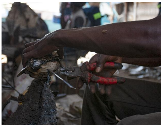
Meget af værktøjet er hjemmelavet, f.eks. som her et lille bjerg af svejseaffald som de bruger til arbejdsbord.

De mindre værksteder ligger i baggårde og i nedlagte fabriksbygninger i fattigkvarterer og tung-industriområdet.