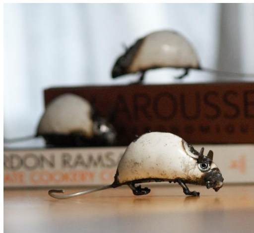
Små hvide mus i hvidt genbrugsmetal.

Vi mødes et par gange om måneden med hvert af værkstederne. Vi ses når vi arbejder med nye ideer eller vi planlægger produktion. Kunstnerne henter forskud og betaling for arbejde eller afleverer produkter til pakkeriet i Harare.