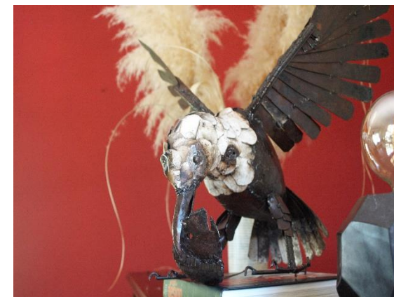
Fiskeørnen af Last&Mishek

Vi prioriterer, at arbejde med producenter fra forskellige lokaliteter for at have forskellige typer og kvaliteter produkter, men også for at tilgodese forskellige politiske tilhørsforhold. For også i Zimbabwe, er de faglærte arbejdere bevidste arbejdstagere med næse for politik. De kan være stærke verbalt, men at udøve sin politiske holdning kræver fortsat ufattelig stort mod i Zimbabwe.