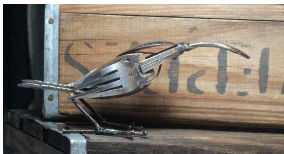
Fugl af gafler

Huset ved Havet (HVV) har handlet med genbrugsmetal- dyr og fugle i mere end 15 år. Vore kunder som Fair Trade Butikkerne og Världsbutikerna i Sverige støtter vedvarende 100 svejsere og deres familier. - Producenter der arbejder i baggårde og nedlagte fabriksbygninger i de store byer.